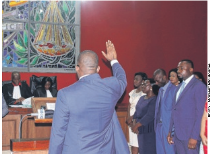
Les nouveaux OPJ ont solennellement juré et promis d'assumer correctement leur travail.

tence spéciale et les met de facto sous la tutelle du ministère public. "Mais le serment n'est pas une formalité administrative. C'est un engagement personnel que vous venez de prendre devant la justice, de remplir votre fonction de manière loyale et surtout d'observer de façon permanente les devoirs inhérents à votre charge",