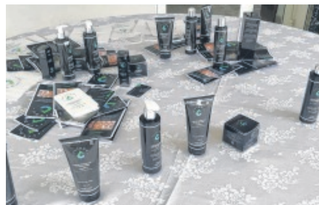
La marque et gamme Ivindo compte 6 produits.

retour aux sources s'imposait". La marque, composée de gel douche, de lait pour le corps, de sérums an-