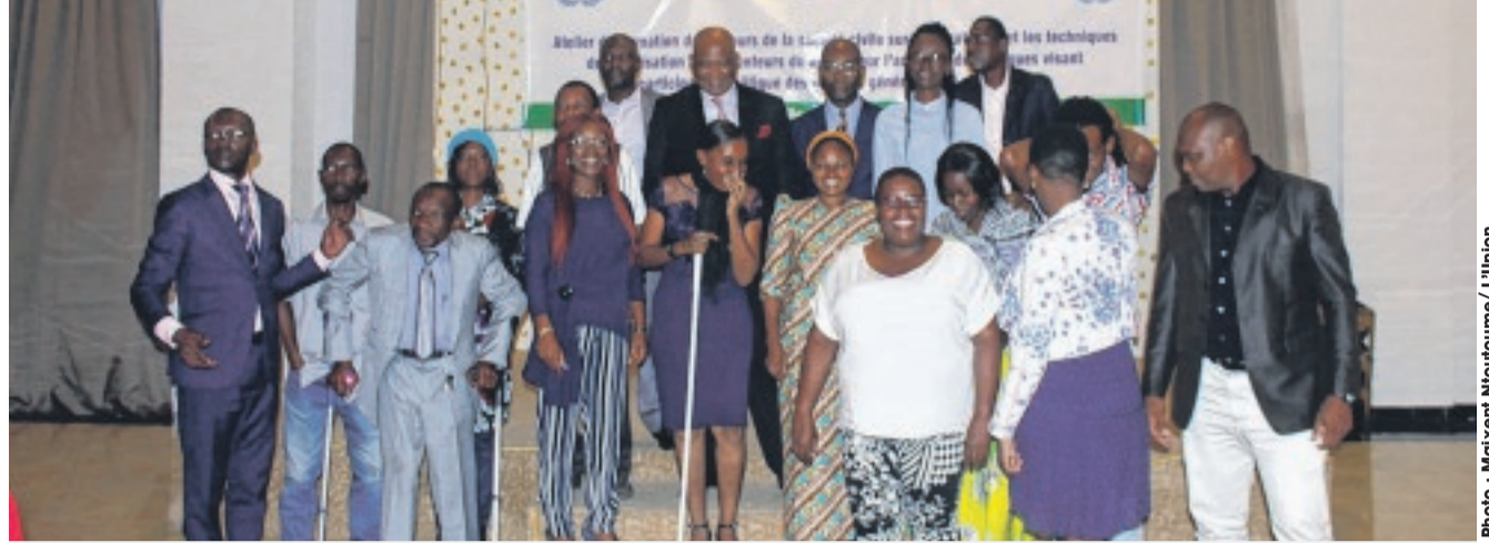
Les participants au terme des assises.