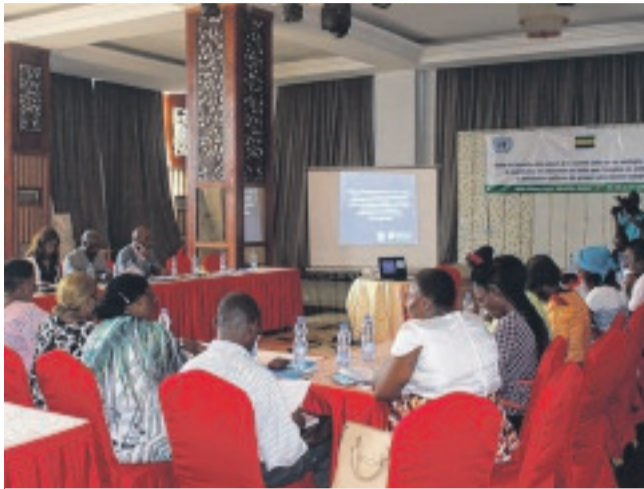
Plusieurs ONG de défense des droits de l'Homme ont participé à la formation.