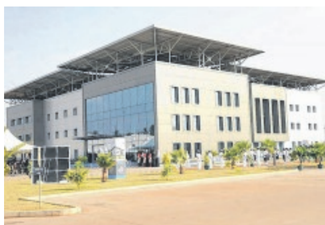
Pérenco est le leader national dans la production de gaz naturel liquéfié.

Ecofin. Ce rapport montre également le changement de paradigme énergétique sur le continent qui se traduit par un fort engouement pour le GNL. Lesdits investissements sont attendus dans des projets au Nigeria, notamment celui du septième train de la NLNG ; en Egypte, avec les développements des capacités dans la Méditerranée ; au Mozambique, en Mauritanie, au Sénégal, au Cameroun, en Afrique du Sud,