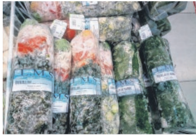
Les légumes et assaisonnements vendus à Cath-multi services. Photo de droite : L'aubergine amère assaisonnée et conditionnée dans des pots et prête à être consommée.

Catherine met à la disposition de la clientèle des compositions de lé-