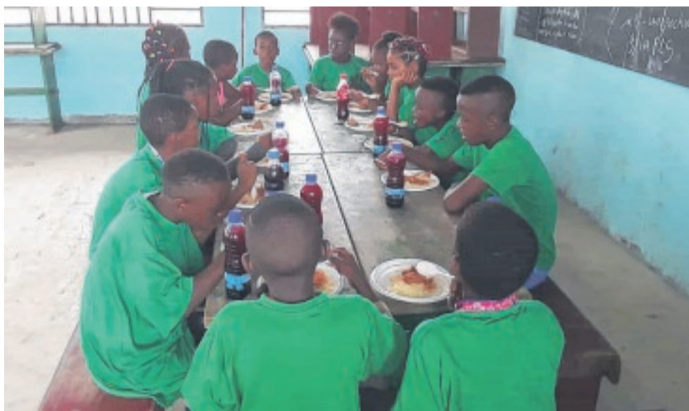
Le repas est assuré.

La formation qui a débuté le 21 août dernier, s'étend jusqu'au 30 septembre prochain. Les participants plancheront, entre autres, sur les notions élémentaires du secourisme : l'origine, l'alerte, le balisage, les différents malaises, le bandage et le pansement, en plus de la trousse à pharmacie et sa composition. Pour la circonstance, une cantine a été ouverte