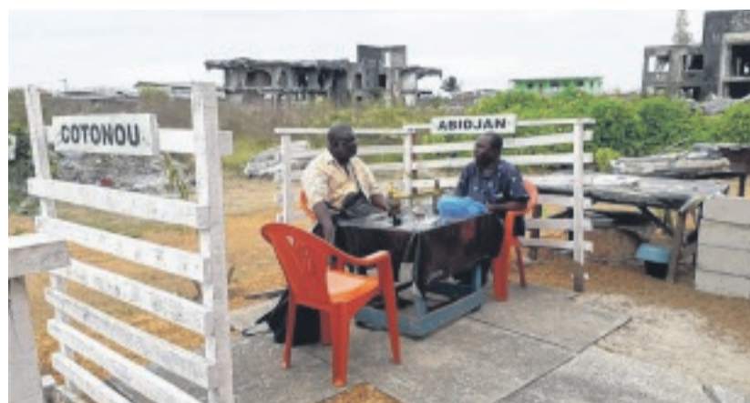
En saison sèche, plusieurs clients préfèrent s'abreuver en plein air.