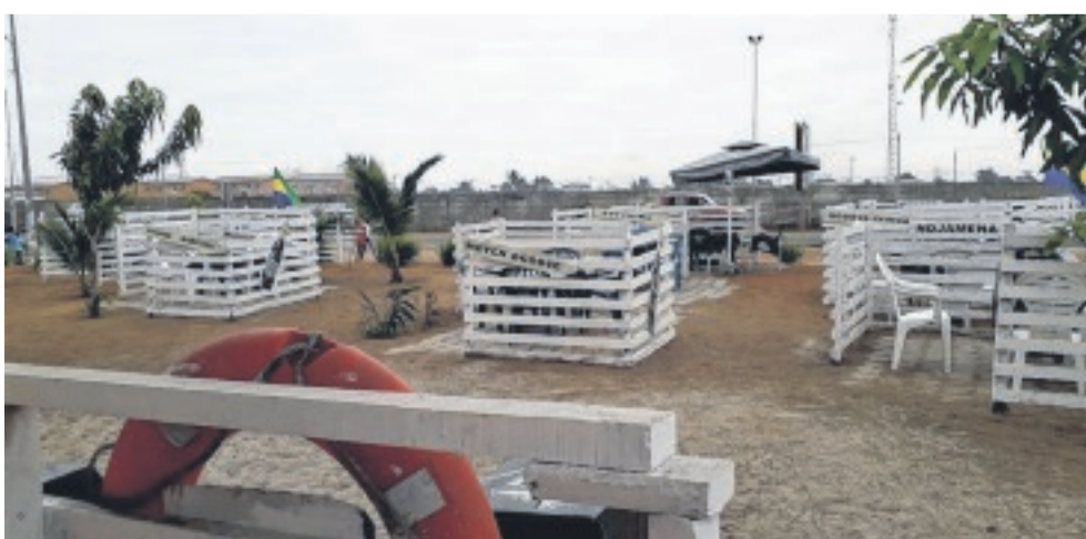
Une ingéniosité que les adeptes des maquis apprécient.

tendre des soirées footballistiques pour se retrouver entre amis et passer du