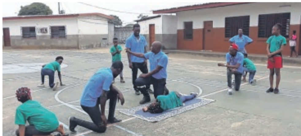
Une phase d'apprentissage aux techniques de secourisme.

des enfants dans le secourisme. Les techniques ainsi apprises leur permettront de prendre non seulement conscience de la valeur de l'être humain, mais aussi d'accroître l'esprit d'entraide et de raffermissement des liens.