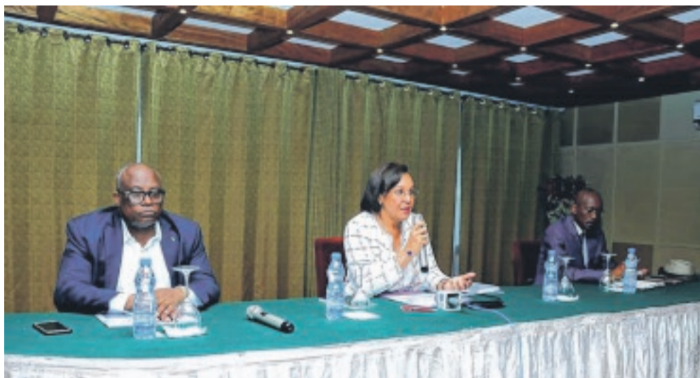
La ministre Madeleine Berre (micro), lors de son intervention.