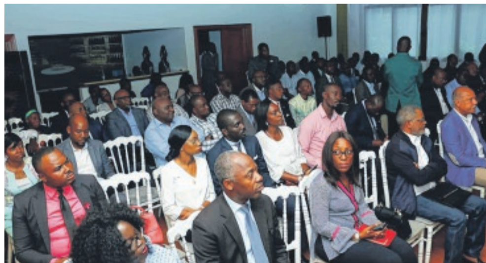
Une vue de l'assistance.