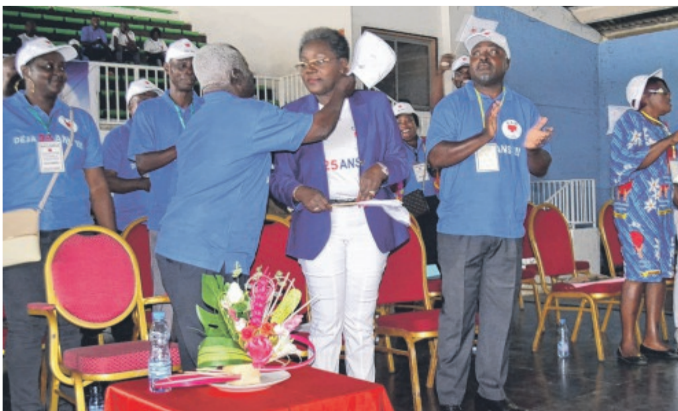
Le désormais ancien président du CLR congratulant la nouvelle responsable du directoire dudit parti.