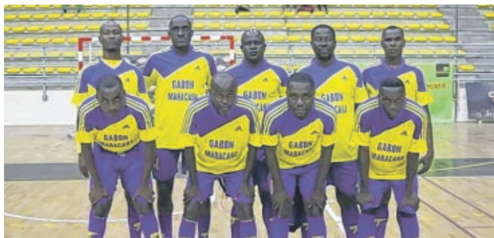
Les «Experts du Gabon» sont champions du Gabon, édition 2018-2019.