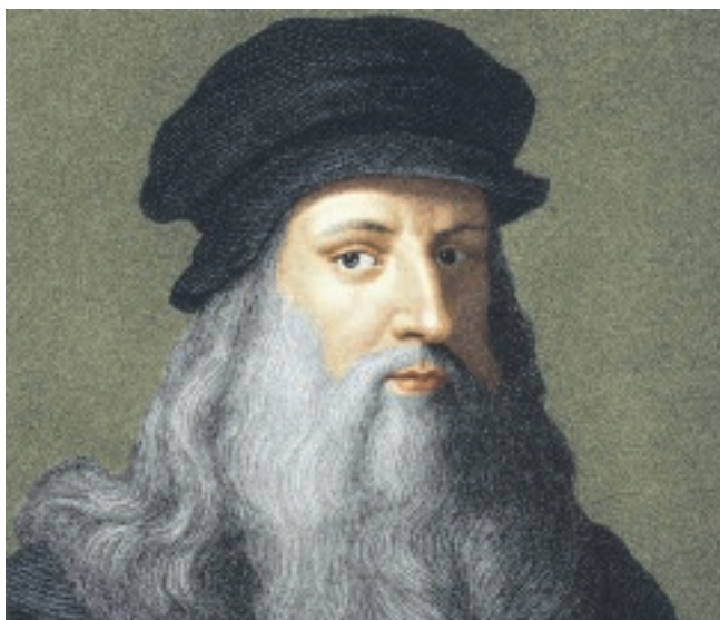
Léonard de Vinci est largement considéré aujourd'hui comme ayant été en avance sur son temps.