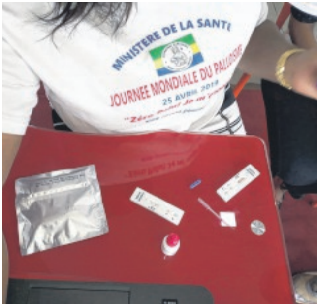
Le kit de dépistage du paludisme, un précieux outil de lutte contre la pathologie.

À cet effet, les membres de Gfan-Gabon ont saisi