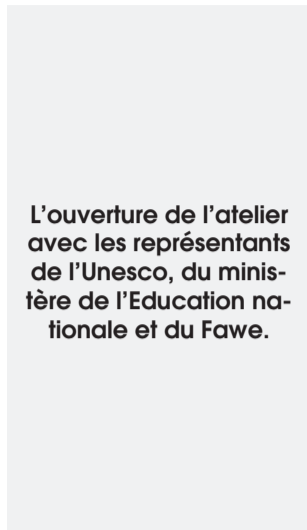
L'ouverture de l'atelier avec les représentants de l'Unesco, du ministère de l'Education nationale et du Fawe.

Conçu et proposé par l'antenne Gabon du Forum des éducatrices africaines (Fawe), ce manuel souligne, selon