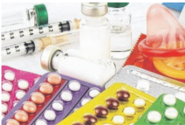
Malgré la batterie de moyens de contraception, les grossesses non-désirées demeurent en hausse au Gabon.

Des problématiques qui touchent au plus haut point la jeunesse gabonaise. Car, le constat fait sur le terrain par certaines organisations non gouvernementales telles que le Forum des éducatrices africaines, antenne Gabon (Fawe-Gabon) relèvent