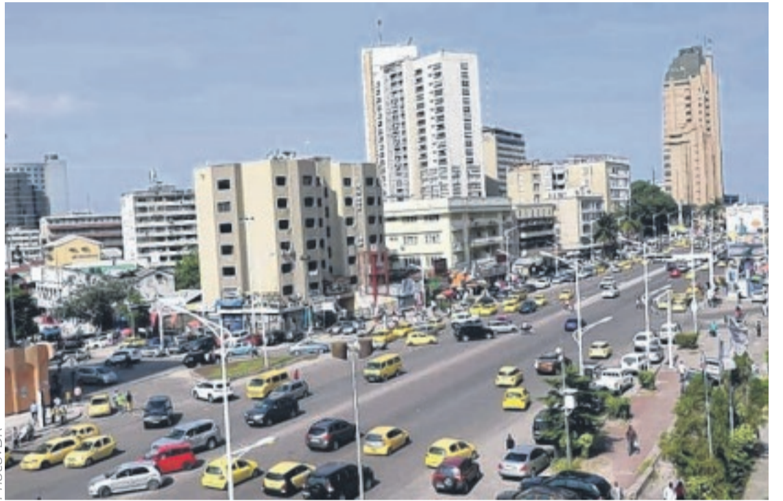
Une délégation gabonaise s'est rendue la semaine dernière à Kinshasa pour préparer l'arrivée des Panthères mercredi.