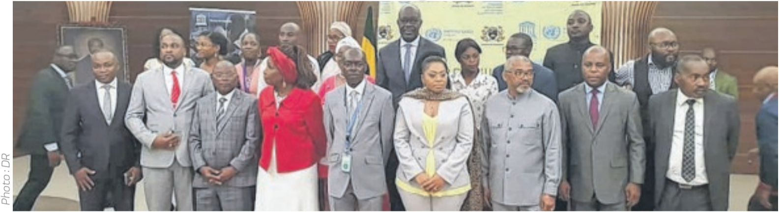
Libreville devra présenter une meilleure image d'ici 2050.

L'ATELIER de l'appel à candidature des jeunes des six arrondissements de Libreville, âgés de 18 à 35 ans, pour la création d'un concept expérimental de prospective dénommé "Laboratoires du nouveau monde" a été lancé