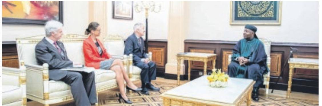
L'entretien avec l'émissaire irlandais s'est déroulé dans la convivialité.

A noter que dans la même foulée, le numéro un gabonais a reçu le secrétaire général de la Communauté économique des Etats