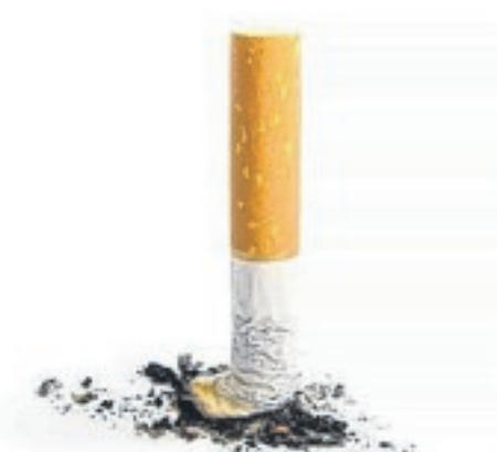
Un des facteurs de l'infertilité, le tabac divise presque par deux les chances d'avoir un enfant.