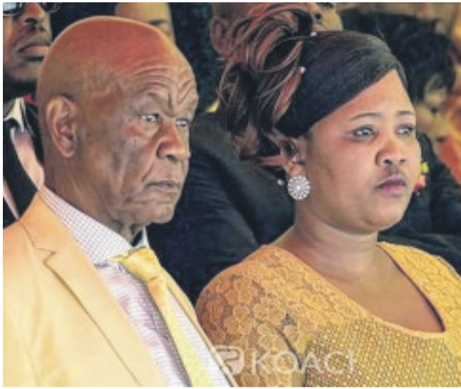
Le Premier ministre, Thomas Thabane, et sa défunte épouse.