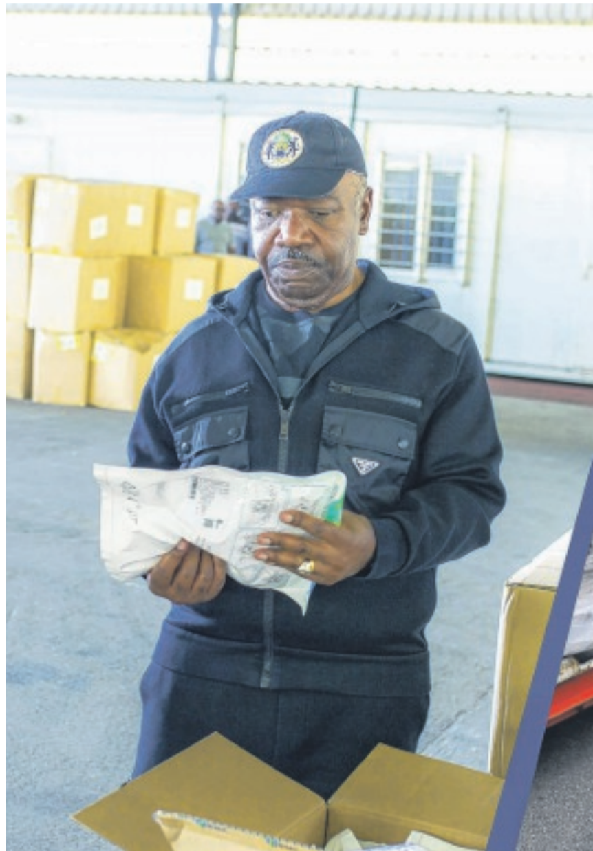
Le président de la République, Ali Bongo Ondimba, en réceptionnant le matériel médical.

Aujourd'hui, le comportement de certains compatriotes suscitent des inquiétudes. Ce qui devrait davantage interpellier le gouvernement à imaginer d'autres mécanismes, pourquoi pas les plus coercitifs, afin de faire comprendre à tout le monde que l'heure n'est pas à la plaisanterie. Alors là, pas du tout !