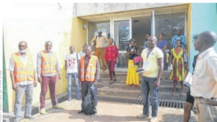
Les agents de Radio 9.