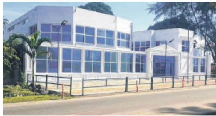
Vue du lycée international d'excellence de Port-Gentil.

Situé au quartier Sassec, dans le premier arrondissement, le LIEP offre un cadre propice à l'apprentissage, de par ses équipements et son équipe pédagogique. Le lycée compte une vingtaine de salles de classe, toutes climatisées, avec une capacité de 30 élèves chacune. Mais, aussi, un Centre de documentation et d'information (CDI).