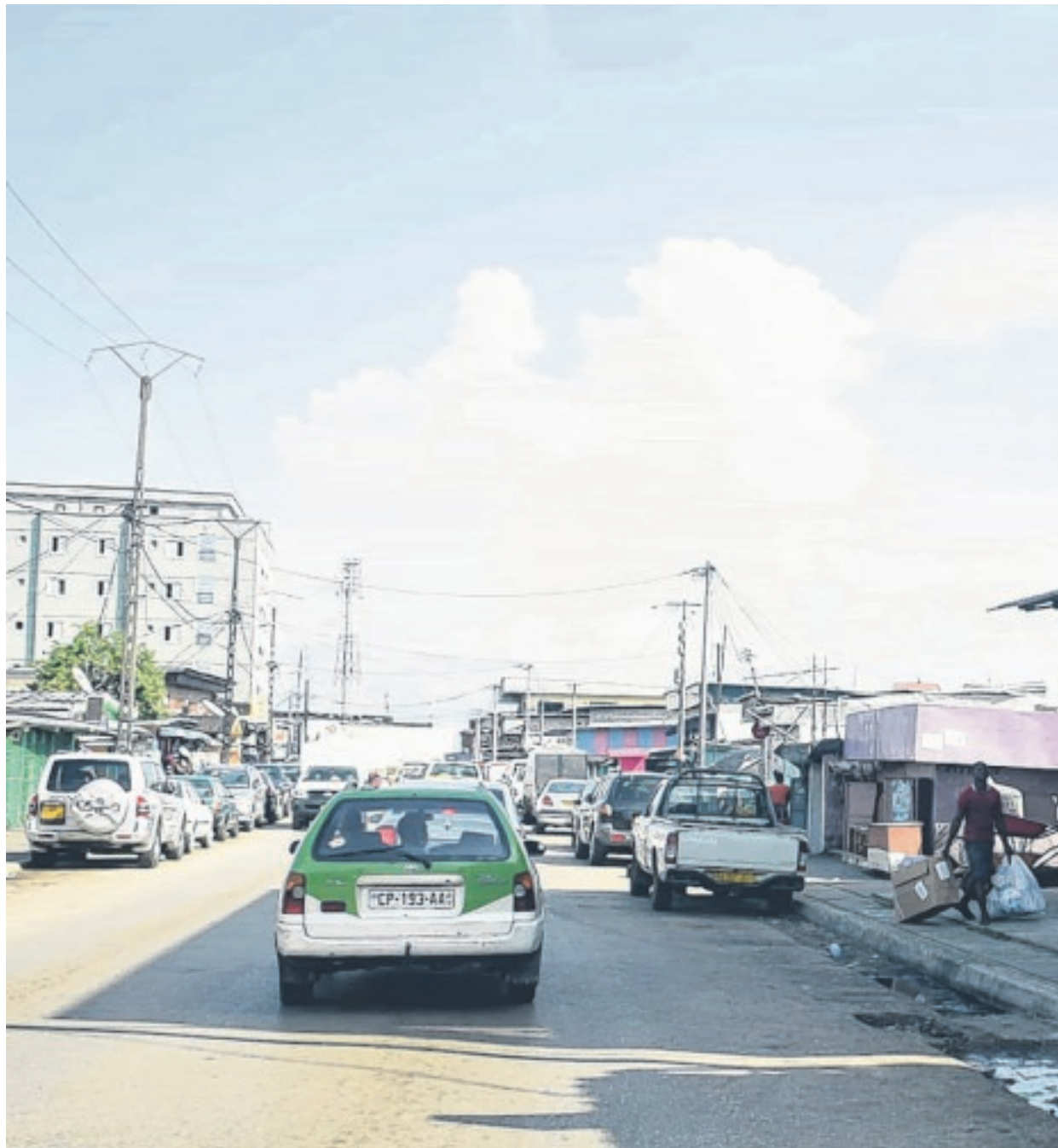
Qu'importe si les modalités de leur réouverture n'ont pas encore été précisées, quincailleries, salons

En ce qui concerne les déplacements vers l'intérieur du pays et vice versa, on note un bilan satisfaisant. Les forces de défense et de sécurité ont veillé au grain. Tant et si bien que, à contrario, le ravitaillement des marchés de Libreville, qui s'approvisionnent à partir de l'intérieur du pays, ont failli en faire les frais. Et que notamment dans la ville de Bitam, le nombre des cas testés positifs n'ait pas augmenté, ne peut être que la conséquence du travail que les équipes médicales, ainsi que les forces de l'ordre s'emploient à accomplir, à côté des campagnes de sensibilisation de certaines ONGs. Mais dans l'arrière-pays aussi, pour de nombreuses localités, il est apparu que les gestes barrières (et même le Covid-19 lui-même) étaient assimilés à "une vue de l'esprit". Le port de masque, la distanciation sociale, l'hygiène des mains... se heurtant à une farouche résistance des populations.