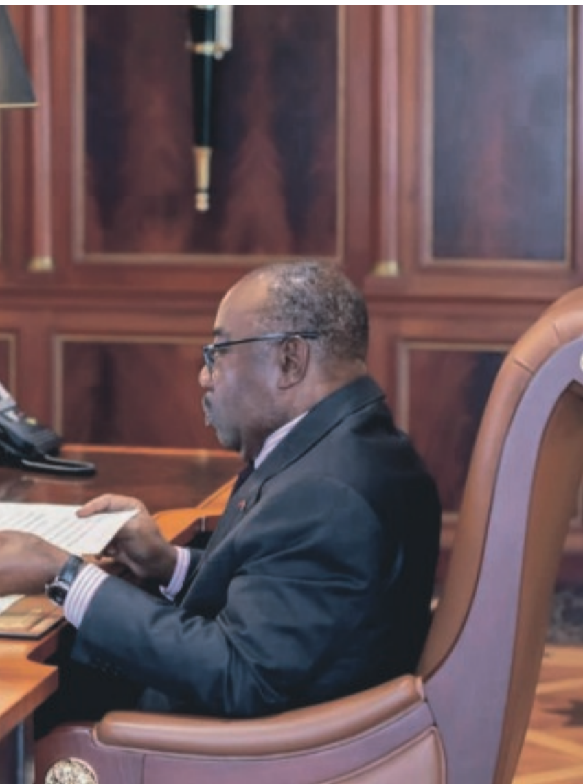
Le Conseil des ministres du 12 juin 2020 à Libreville.

Un nouveau prêt de 5 milliards de francs pour renforcer la lutte contre la pandémie