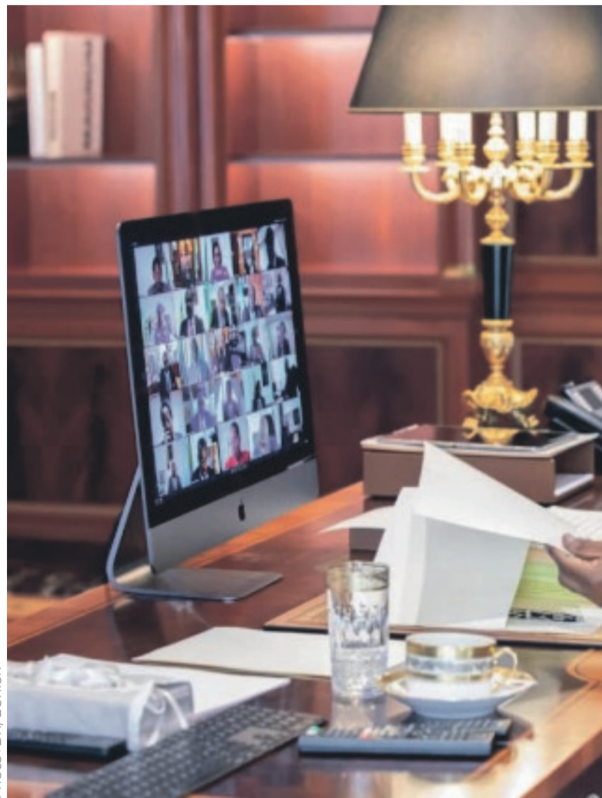
Le chef de l'Etat, Ali Bongo Ondimba, dirigeant par visioconférence le

En termes de demande, le ralentissement par rapport aux objectifs de la Loi de finances initiale s'expliquerait par la baisse de la demande locale, en lien avec la réduction attendue des investissements publics et privés, la baisse de la consommation et le repli de la demande internationale des biens exportés.