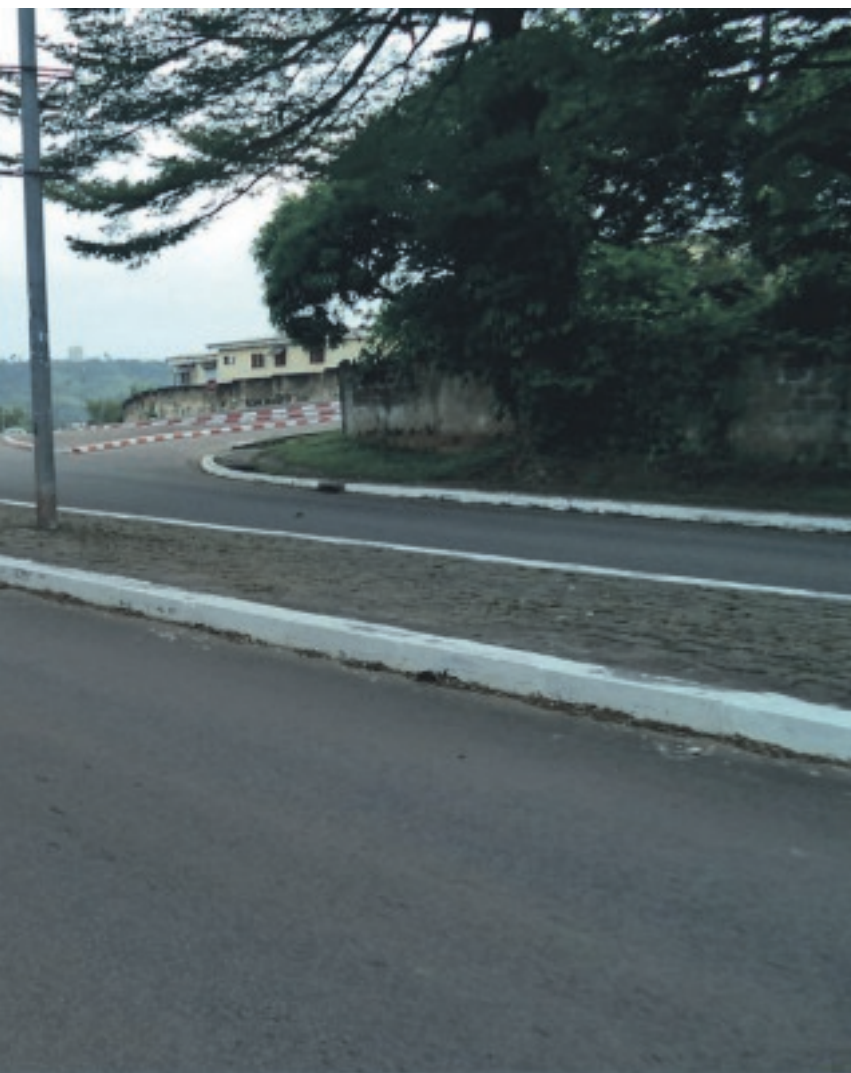
...n, routier, ferroviaire, fluvial et maritime) est désormais effective sous

Si les frontières aériennes ont été ouvertes, les démarcations maritimes et terrestres par contre demeurent fermées. "Seuls les approvisionnements en produits pétroliers, gaziers et vivriers sont admis", a poursuivi M. Matha. Restent aussi fermés, pour le moment, les salles de jeux, les cinémas, les musées, les lieux de culte, les bars, les boîtes de nuit et les motels, entre autres. Comme sont interdites les manifestations culturelles et sportives. Simple-ment parce que la mesure interdisant le regroupement de plus de dix personnes est toujours en vigueur.