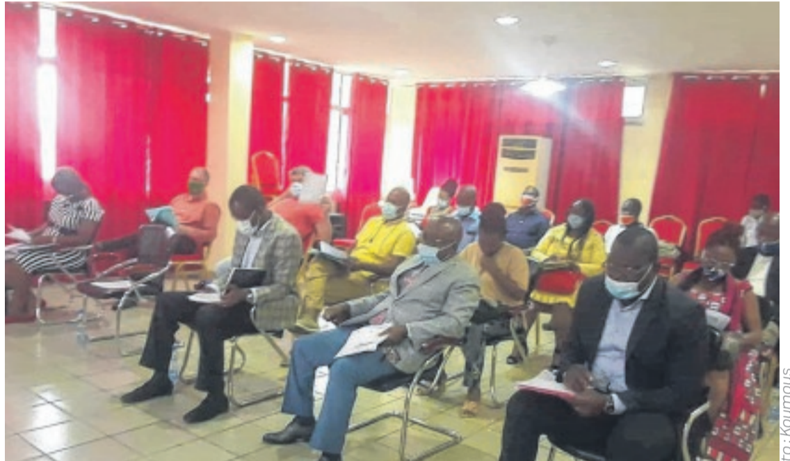
Opérateurs et syndicats pendant la réunion au gouvernorat.