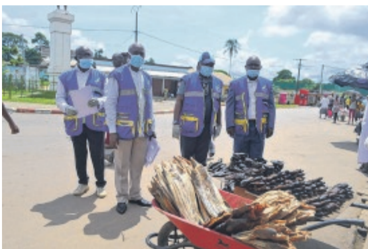
Les agents contrôleurs de la DGCC sur le terrain.

C'ÉTAIT pour vérifier si les prix homologués sont respectés par les commerçants.