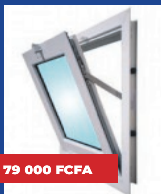
Fenêtre à soufflet 600 x 600mm