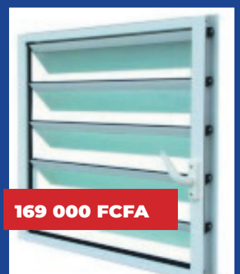
Fenêtre à jalousie 600 x 800 mm