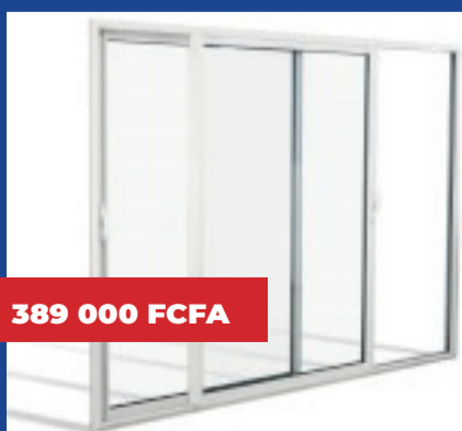
Porte fenêtre coulissante L 1600 H 2100mm

Produits disponibles selon la limite du stock