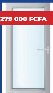
Porte à la française 900 x 2100mm