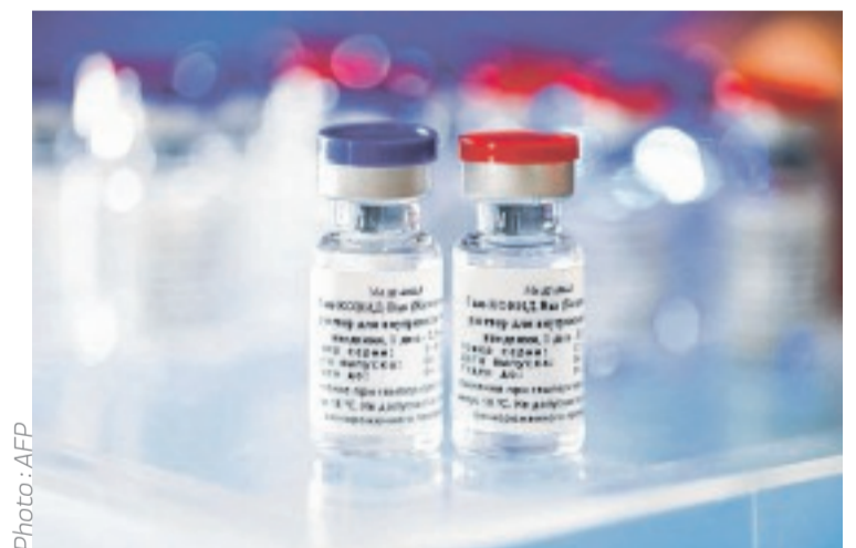
Le «Sputnik V», le vaccin développé par la Russie.

C'EST le président russe en personne qui l'a annoncé hier : son pays est parvenu à développer un vaccin "efficace" contre le Covid-19. "Un vaccin contre le nouveau coronavirus a été enregistré ce matin (hier nldr) pour la première fois au monde", a déclaré Vladimir Poutine lors d'une réunion avec le gouvernement, ajoutant qu'"il fonctionne assez efficacement, crée une immunité stable et (...) qu'il a passé tous les contrôles nécessaires". Le ministère de la Santé assure, pour sa part, qu'une double inoculation "permettait de former une immunité longue", estimant qu'elle pouvait durer "deux ans". Le vaccin en question, élaboré conjointement par le ministère de la Défense et le Centre d'épidémiologie et de microbiologie russe Gamaleïa, a été baptisé "Sputnik V" (V comme vaccin, nldr), en ré-