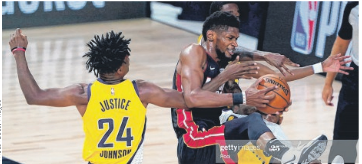
Chris Silva et ses coéquipiers doivent monter en puissance ce soir.

play-offs démarre officiellement cette nuit pour la franchise floridienne, avec une nouvelle série de victoires contre la formation d'Indiana Pacers, les coéquipiers de Chris Silva Correia doivent désormais se remettre en selle pour espérer décrocher, une nouvelle fois, le titre de champion après le sacre de 2012. Dans cette perspective, la formation de Miami a perdu un de ses joueurs clés sur blessure. Touché au cou, l'ailier de Miami Heat Derrick Jones Jr souffre d'une entorse cervicale. Si l'attention est concentrée sur le duel des étoiles entre Jimmy Butler pour Miami et T.J. Warren durant toute une série de play-offs, Chris Silva devra monter en régime pour conforter sa place dans le cinq de départ.