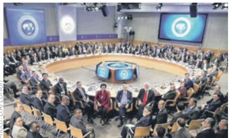
Les administrateurs du Fonds lors d'une précédente réunion consacrée au Gabon.

De fait, le FMI note avec satisfaction le fait que pour préserver la qualité des dépenses d'urgence dans le secteur de la santé, entre autres, les autorités gabonaises se sont engagées à publier chaque trimestre les dépenses des fonds d'urgence, à commander un audit indépendant de ces dépenses réalisé par un tiers dans les six mois suivant leur décaissement, et à publier les résultats en ligne dans un délai de neuf mois après la fin de chaque exercice.