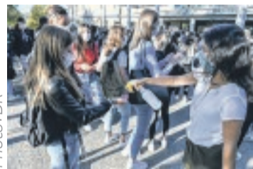
Plusieurs pays européens ont effectué leur rentrée des classes hier.

La pandémie à coronavirus semble malheureusement loin d'être sur une pente descendante à travers le monde, même si les situations diffèrent selon les pays. Le cap des 25 millions de personnes contaminées a été franchi lundi dernier, et 851 321 personnes sont décédées au cours de ce laps de temps, selon les dernières statistiques de l'université Johns-Hopkins qui fait référence en la matière. Connaissant une forte recrudescence de contaminations depuis le mois de juillet, Hong Kong a lancé hier une campagne de dépistage massif du Covid-19. Plus d'un demi-million de Hongkongais se sont déjà inscrits pour bénéficier de ce dépistage gratuit, malgré la méfiance suscitée par l'implication de médecins et d'entreprises de Chine continentale. En Europe où le virus est particulièrement virulent dans plusieurs pays, des millions d'enfants ont repris le chemin de l'école, masque sur le visage