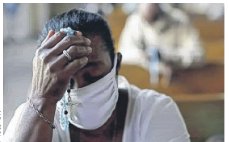
Le Covid-19 peut également impacter la santé mentale.

L'APPARITION du Covid-19 s'est accompagnée d'un lot de dégâts sur les plans socio-économique et sanitaire. Outre le fait que la maladie affecte physiquement les personnes atteintes, elle impacte également la santé mentale du patient, et même son environnement immédiat. Les scientifiques ne cessent d'ailleurs d'alerter sur les répercussions à long terme de la pandémie à Covid-19 sur la santé mentale et le bien-être émotionnel des citoyens du monde entier. Selon nos confrères du site OperaNews, plusieurs recherches évoquent un "tsunami" potentiel de troubles liés au stress, en raison de cet événement traumatisant que connaît la planète. En plus des symptômes neurologiques et psychiatriques, y compris la psychose et les symptômes de type démence neurocognitive observés chez les patients atteints de