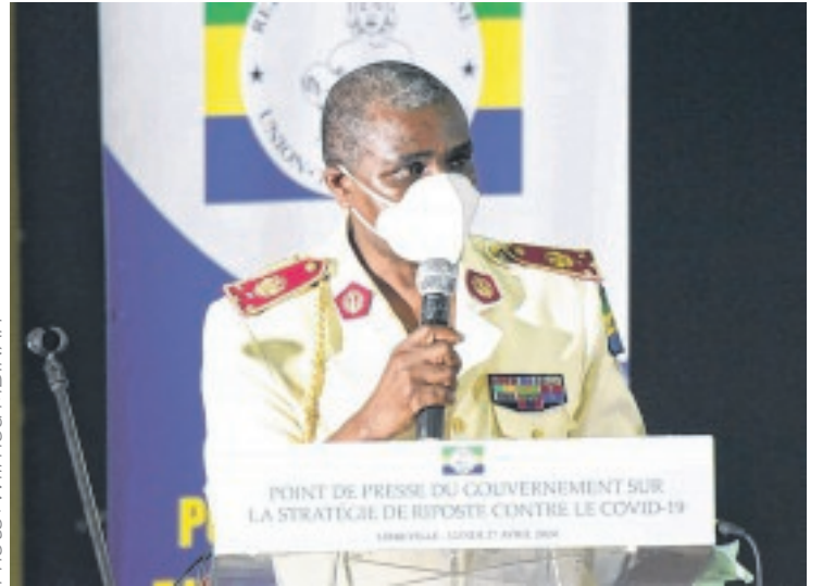
Le Pr Romain Tchoua lors d'une précédente intervention.

Un hôpital de campagne dans la capitale, la mise à disposition de matériels de réanimation dans toutes les provinces à travers le projet AFD, la formation de 2296 personnes en charge de la surveillance épidémiologique, entre autres, par le Copil et des partenaires comme l'AFD, l'OMS ou encore le CDC-Africa, etc., sont autant de points qui ont contribué à contenir le Covid-19.