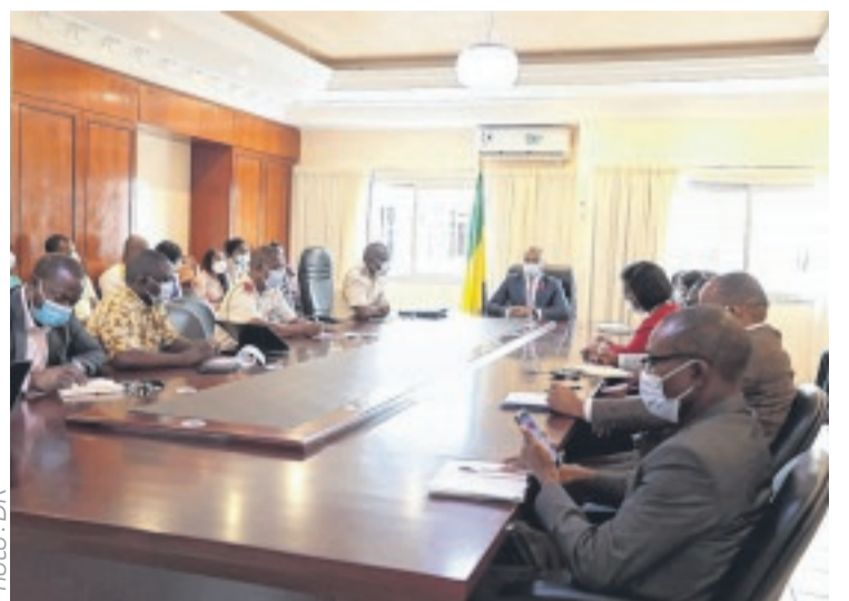
Le ministre de la Santé échangeant avec les acteurs de la lutte contre le coronavirus au Gabon.

En effet, la France, un des pays du Vieux Continent où l'épidémie de coronavirus est hors de contrôle, est à nouveau confinée depuis ce vendredi 30 octobre pour au moins quatre semaines. Le virus ayant évolué dans l'Hexagone, au cours des dernières semaines à une vitesse que même les prévisions n'avaient pu anticiper. Ainsi, les records de contaminations et de décès s'enchaînent là-bas. Au 28 octobre, la barre des 3 000 personnes en réanimation a été franchie et la France faisait état de 20 207 patients Covid-19 hospi-