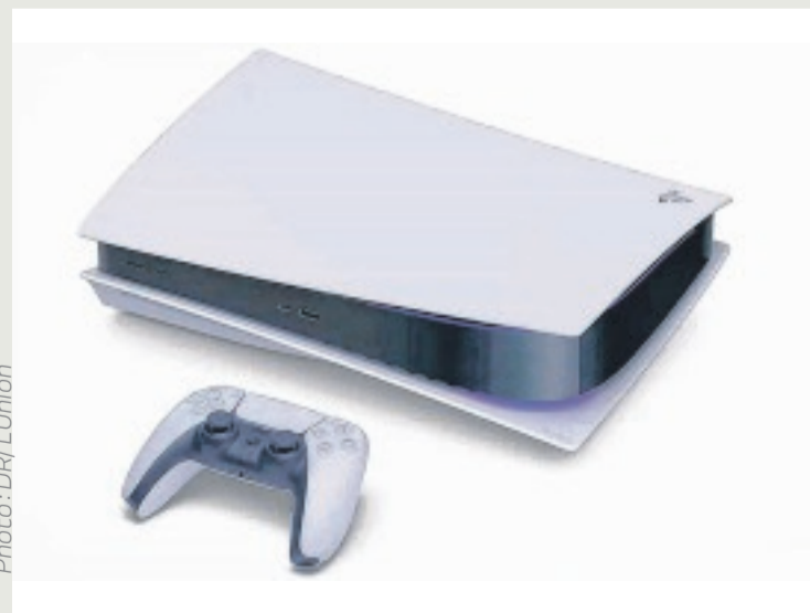
mise à jour du firmware). Le second concerne le bruit émis par un des modèles de ventilateur choisi pour la PS5. "Mais il semble que le souci vienne surtout d'un autocollant situé à l'intérieur de la console", affirme Phonandroid.

COMME de nombreux sites spécialisés, presse-citron.net a indiqué hier que "la nouvelle PS5 a réalisé le meilleur lancement de l'histoire des consoles de jeux vidéo". Alors que la console a été lancée le 12 novembre passé aux États-Unis et au Japon, l'incroyable engouement de l'Europe pour ce support a permis d'améliorer son score. "Sony confirme donc que la PS5 est parvenue à faire mieux que la PS4 en 2013, qui était alors créditée de 2,1 millions de ventes en seulement deux semaines de commercialisation", explique le site précédemment mentionné. "On parle de 2,3 millions de ventes environ", poursuit-il. Du fait de son succès, la PlayStation 5 est "en rupture de stock chez tous les revendeurs", s'est étonné Phonandroid. "Afin de tirer profit de la pénurie, des internautes n'hésitent pas à vendre des PS5 à des prix exorbitants sur des sites comme eBay ou LeBonCoin", souligne-t-il encore. D'autres, apparemment plus impatients, préfèrent braquer des entrepôts pour s'emparer de ces consoles de jeux. Sony promet, néanmoins, de nouveaux stocks pour faire face à la demande. Les nombreux joueurs qui veulent vite mettre la main sur une PS5 ne savent sans doute pas que cette dernière est actuellement confrontée à des soucis techniques. Le premier fait que la console s'éteint rapidement après le démarrage (ce qui peut se régler via une simple