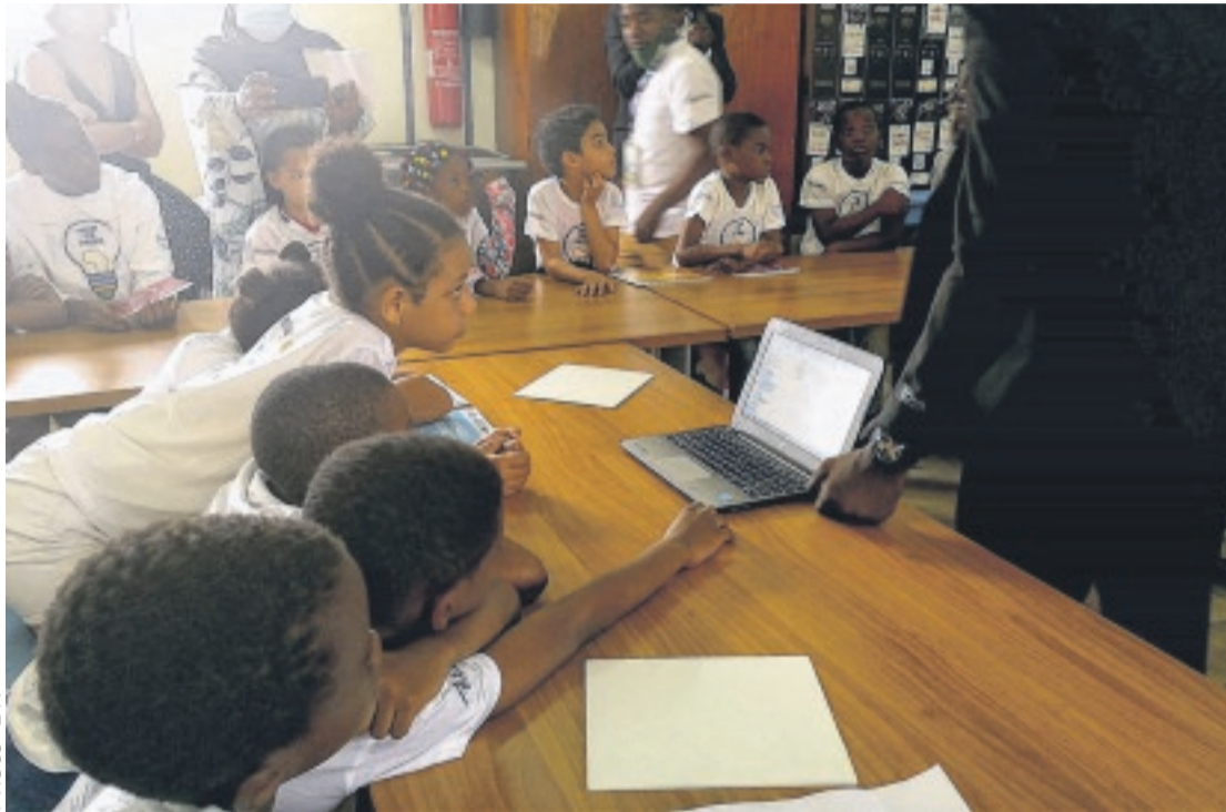
Des jeunes en pleine formation sur le digital.

En effet, cette compétition est axée sur le codage à partir du logiciel Scratch. Via des vidéos, les participants devront créer, sous forme de jeu, l'école qu'ils souhaitent. Autrement dit, comment ils imaginent l'École publique de Gros-Bouquet 1 demain. Ces jeunes participants au programme Africa code week, plus précisément à Africa code challenge, ont été sous la houlette de différents coachs pendant 4 jours, pour une formation qui s'achève ce vendredi. "Ils vont apprendre à manipuler, à se familiariser avec le logiciel Scratch ; un logiciel facilement téléchargeable sur PlayStore. Le but est de sélectionner les trois meilleurs qui iront représenter le