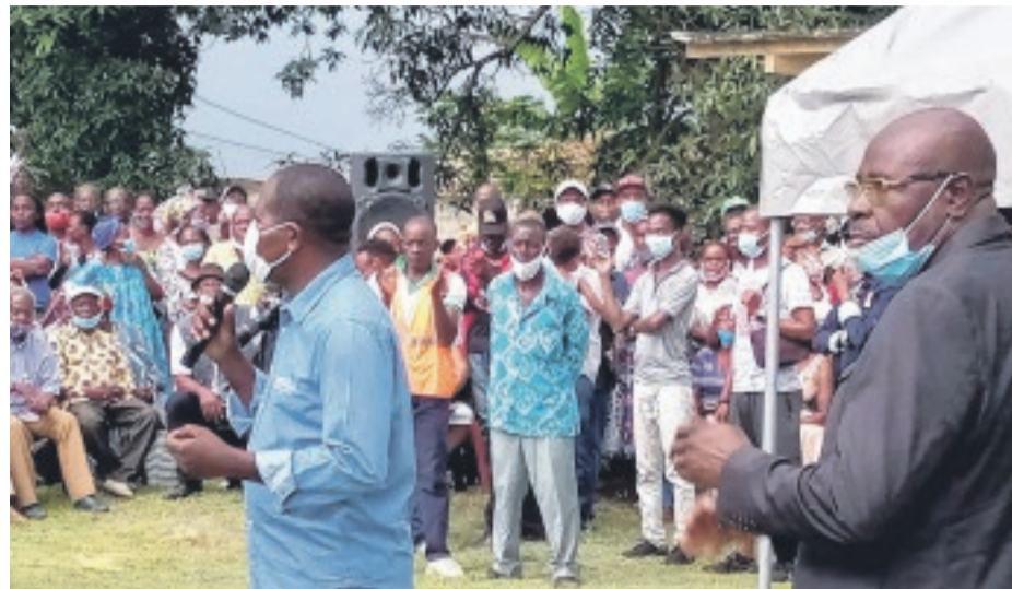
Le ministre Otounga et le maire Mbele Asseko lors de la rencontre avec les Bitamois.

Pour joindre l'utile à l'agréable, s'inscrivant ainsi dans la politique de solidarité et de partage prônée par le président de la République, une enveloppe de 3 millions 500 mille francs a été gracieusement remise par les deux hommes politiques aux populations présentes, en guise de remerciement pour leur disponibilité.