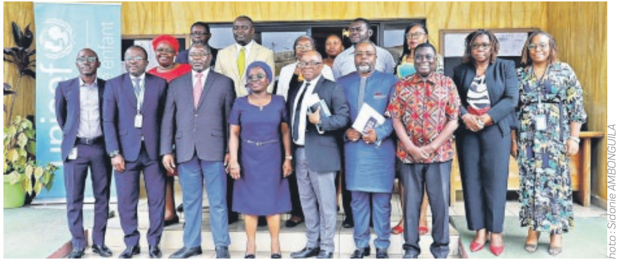
Photo de famille au terme de rencontre.