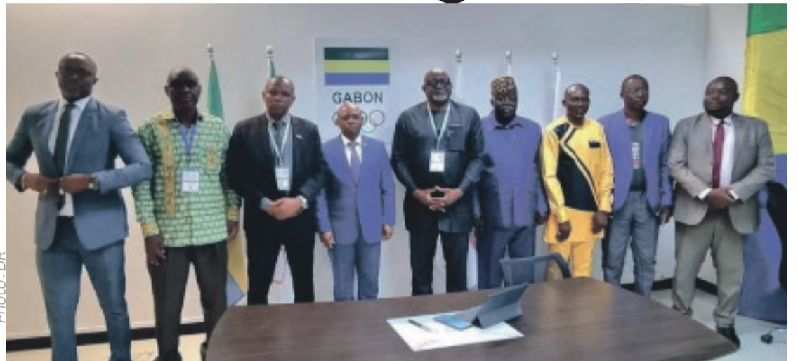
La boxe gabonaise est désormais sur les rails.

Les émissaires de la CAB sont venus remercier ce dernier pour l'implication du Comité olympique dans l'aboutissement du processus électoral au sein de la Fégaboxe. Ce qui augure des lendemains meilleurs pour le noble art gabonais. "L'élection s'est très bien déroulée. Désormais le Gabon est notre priorité. Il faut maintenant tout organiser. Nous avons beaucoup de programmes pour le Gabon. Au niveau de la formation des arbitres, des juges, des entraîneurs... Et surtout que,