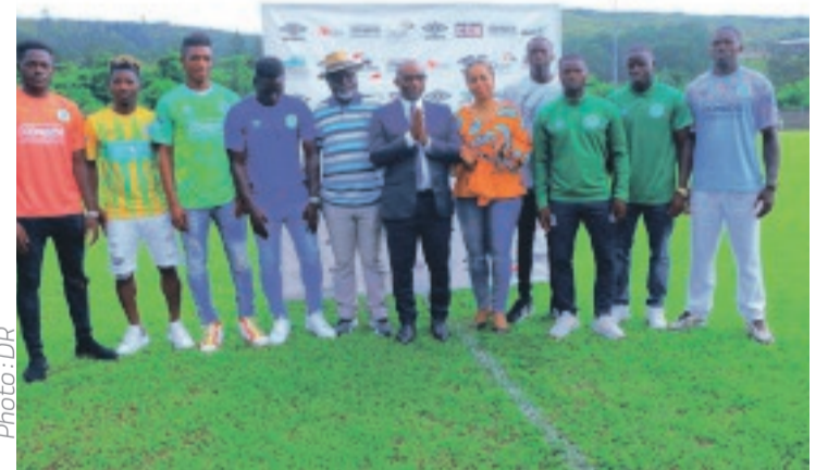
Les nouveaux équipements de Mangasport portés par les joueurs du club.