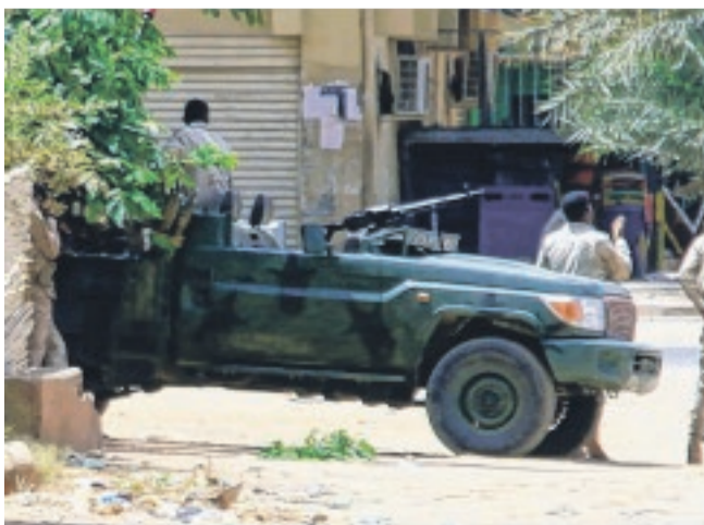
Un calme précaire règne à Karthoum après l'obtention d'un cessez-le-feu.