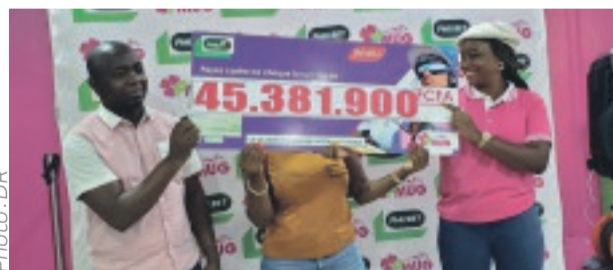
La jeune millionnaire a reçu son chèque hier au siège du PMUG.