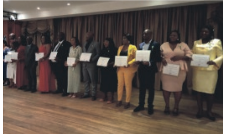
Une vue des agents du Groupe Ceca-Gadis distingués de la médaille du Travail.

Il devait par ailleurs indiquer l'importance de cette journée où Ceca-Gadis répond aux dispositions légales à travers lesquelles, après des durées de travail réglementaires, l'État, saisi par l'entreprise, vient exprimer sa reconnaissance aux employés méritants. Mais sur un autre chapitre, il est revenu sur le dialogue social permanent au sein de l'entreprise pour un