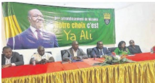
Les hiérarques PDG du 3e siège de Franceville, lors de la réunion à Libreville.

L'actuel ministre du Pétrole a enfin invité les uns et les autres à cultiver l'unité et la cohésion entre les natifs du 3e arrondissement de Franceville. Estimant que l'heure n'est plus aux querelles intestines mais à l'action.