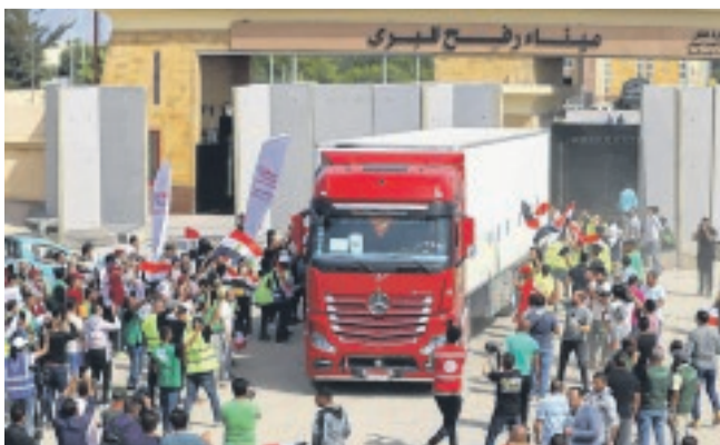
Un camion d'aide humanitaire passant par l'Égypte pour Gaza.

Ce lundi 23 octobre, le chef de la diplomatie européenne, Josep Borrell, a quant à lui réclamé « plus d'aide, plus rapidement » pour la bande de Gaza. Il s'est dit à titre personnel, favorable au cessez-le-feu humanitaire réclamé par le patron de l'ONU Antonio Guterres. « Personnellement, je pense qu'une pause humanitaire est nécessaire pour permettre à l'aide humanitaire d'être distribuée, en particulier pour apporter ce qui va permettre de restaurer les infrastructures de distribution d'eau et d'électricité », a-t-il déclaré, soulignant que ce sujet serait débattu par les ministres des Affaires étrangères des 27 réunis au Luxembourg ce lundi. Plusieurs pays tempèrent cette déclaration, comme l'Allemagne dont la ministre des Affaires étrangères affirme que si « le terrorisme de Gaza » se poursuit, il ne sera pas possible d'endiguer la catastrophe humanitaire. Son homologue tchèque va encore plus loin : il estime qu'une pause humanitaire, un cessez-le-feu, ne pourra être mis en place que s'il s'applique aux deux parties alors que le Hamas continue d'envoyer des roquettes.