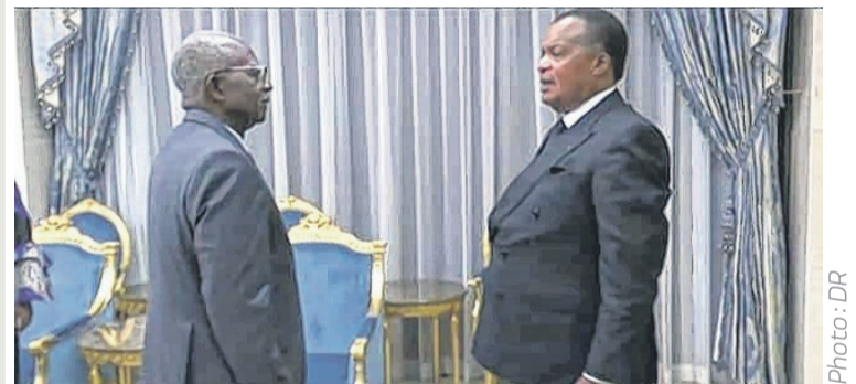
Le président Denis Sassou Nguesso a dernièrement reçu le vice-président gabonais, Joseph Owondault Berre.

LE vice-président de la République (VPR) est allé communiquer officiellement au chef de l'Etat congolais le chronogramme de la Transition.