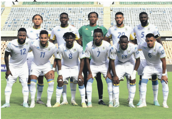
Dès mars 2024, Kappa ne sera plus l'équipementier des Panthères.