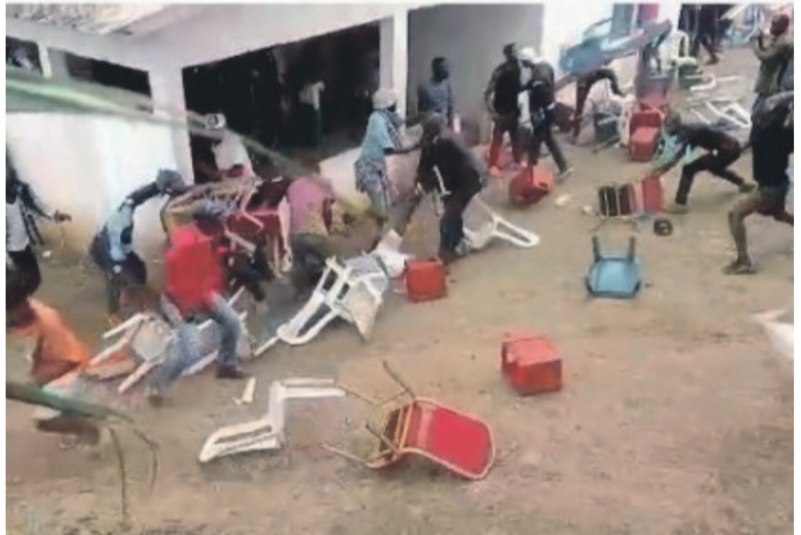
Capture d'écran de la vidéo d'une violente perturbation du meeting de Barro Chambrier à Franceville