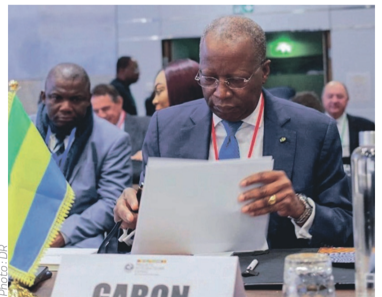
Le ministre des Comptes publics, Charles Mba.

Le Gabon était représenté à cette rencontre par le ministre des Comptes publics, Charles Mba. Ce dernier a présenté aux potentiels bailleurs des projets, dont la construction de la route Kougouleu-Medouneu et Ndendé-Dolisie, en écho à l'engagement renouvelé des plus hautes autorités de renforcer les relations entre le Gabon, les États voisins et l'ensemble des partenaires extérieurs du pays. En dehors du membre du gouvernement gabonais,