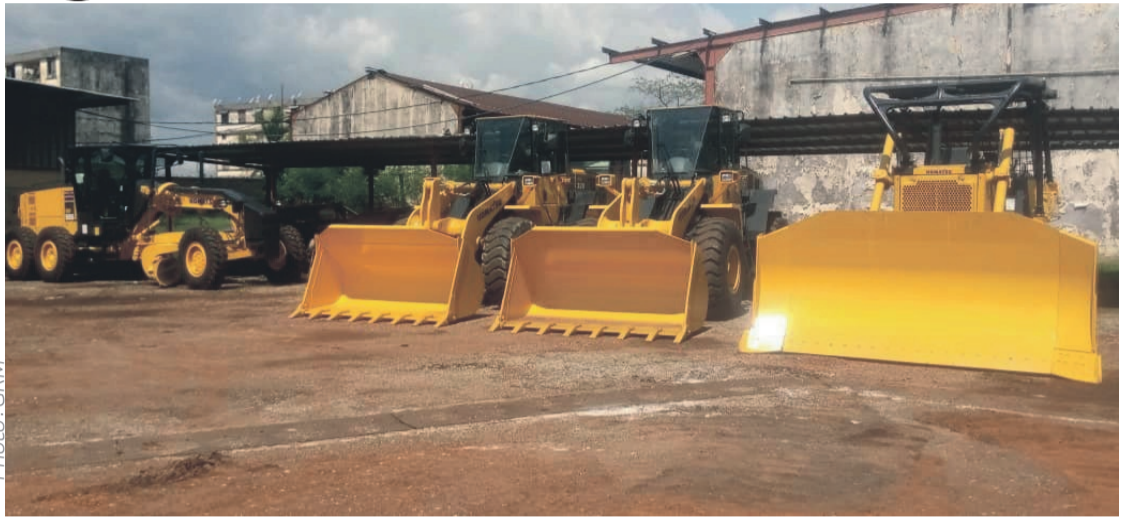
Une partie des engins acquis auprès de Sodim TP par le gouvernement.

Le gouvernement, à travers le département des TP, a élaboré un programme d'urgence à l'effet de maintenir le trafic routier. Les engins ainsi acquis sont mis à la disposition de la Direction générale de l'entretien des routes et aérodromes (DGERA) et vont être déployés pour les zones où l'on annonce l'interruption (risque de coupure) de la circulation. Notamment sur les axes Alembé-Lopé-Mikouyi, Tchibanga-Moabi, Ovan-Mako-