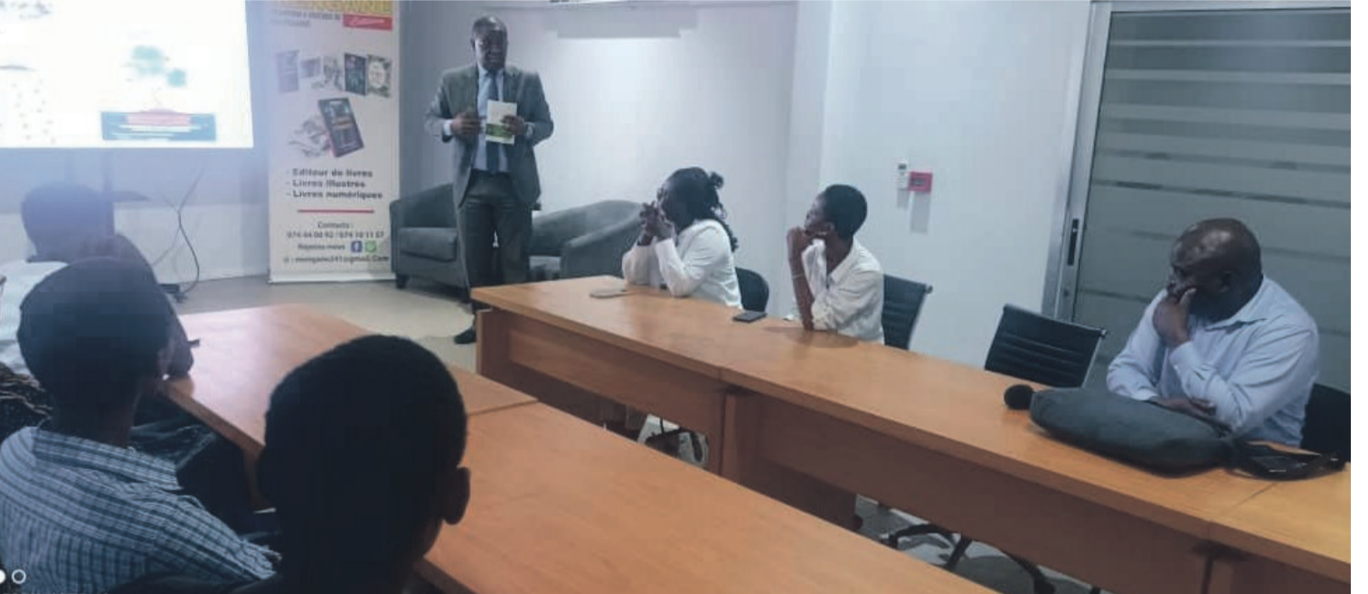
La rentrée littéraire numérique au cours de laquelle les éditions Mengane ont présenté l'application Tradi-tech.