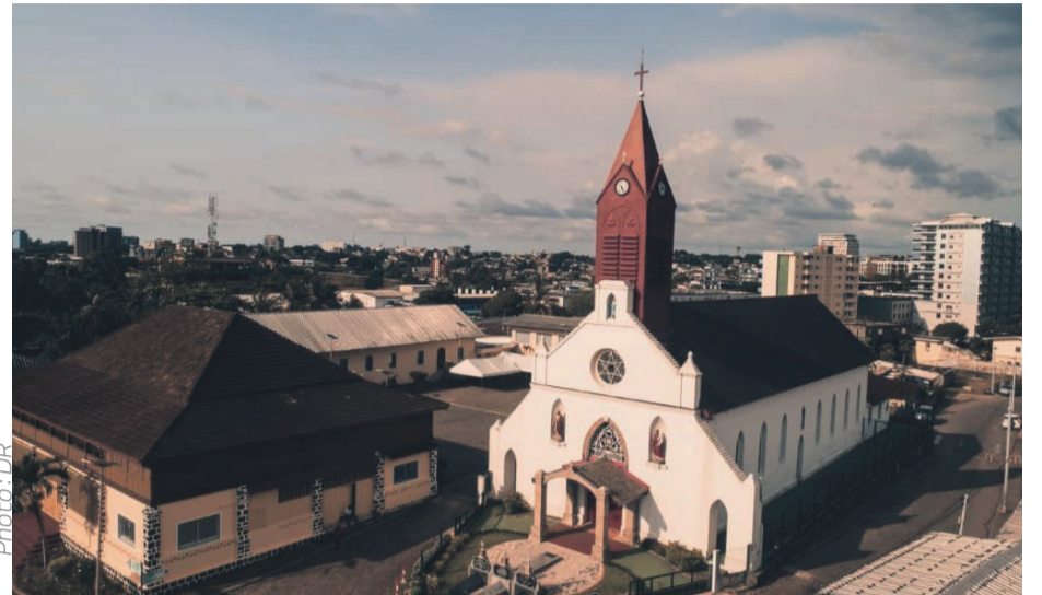
La cathédrale Sainte Marie, celle dont on parle !