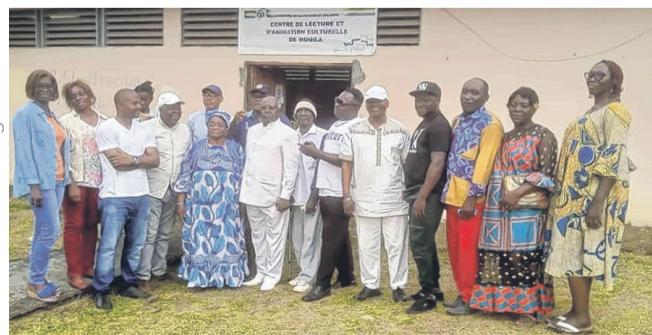
Officiels locaux et responsables du groupe «Nguienu» immortalisent leurs retrouvailles à Mouila.