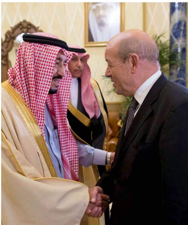
Le ministre français de la Défense, Jean Yves Le Drian, lors d'une visite au Moyen-Orient.

"Nous avons frappé militairement un site extrêmement sensible pour Daech", a affirmé le ministre de la Défense, sans vouloir en dire plus sur la nature des activités visées et sur la présence éventuelle de Français ou francophones sur place. La région de Deir Ezzor est au carrefour de la Syrie et de l'Irak. Elle a été "le noyau stratégique" pour les jihadistes de Daech "lorsqu'ils sont venus de l'Irak pour occuper une partie de la Syrie" et abrite "beaucoup de ressources pétrolières", a souligné M. Le Drian. "Lorsqu'on frappe ainsi, nous sommes en légitime défense, nous frappons pour nous défendre, pour assurer notre propre sécurité", a-t-il martelé. "Nous avons les preuves que dans des camps d'entraînement de Daech en Syrie se préparent, s'organisent des combattants étrangers dont la mission n'est pas d'aller combattre au Levant mais de commettre des attentats en Europe et sur notre propre territoire", a insisté le ministre. Sur la base d'interrogatoires de jihadistes de retour en France, "on a confirmation de ce qui se passe en Syrie aujourd'hui où Daech, notre ennemi, prépare des attaques contre nous".