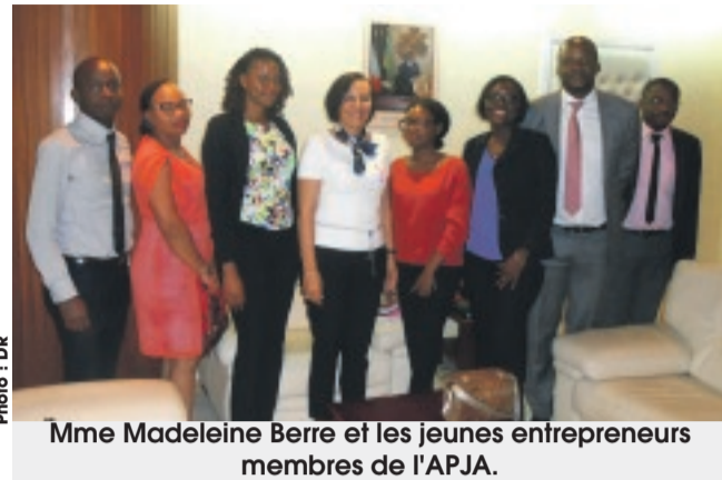
jeunes entrepreneurs mutualisent leurs efforts et leurs talents. Dans une démarche plutôt pragmatique, le membre du gouvernement invite les intéressés à présenter un cahier de charges cohérent et lisible, tout en assurant de la disponibilité de l'administration qu'elle di-