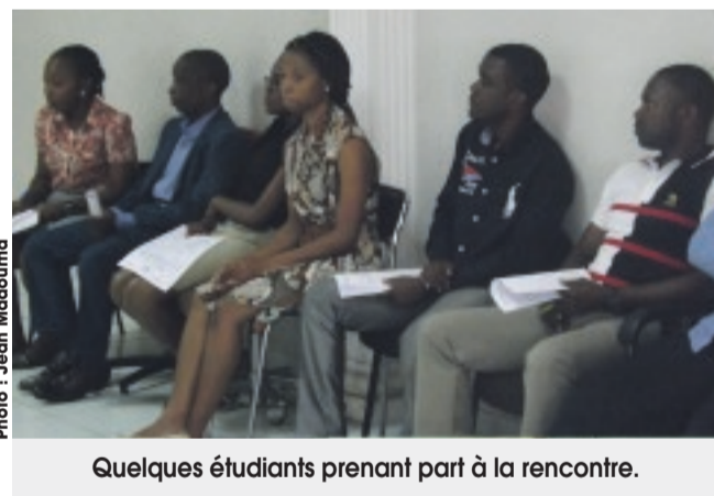
Quelques étudiants prenant part à la rencontre.

de fédérer les énergies, afin de parvenir à des suggestions fortes pour renforcer le sous groupe de travail PFNL de la Commission ministérielle des forêts d'Afrique centrale (COMIFAC). En plus, a-t-elle rappelé, la plate-forme vise à faciliter une meilleure prise en compte des PFNL dans les politiques et stratégies du pays en matière de développement du