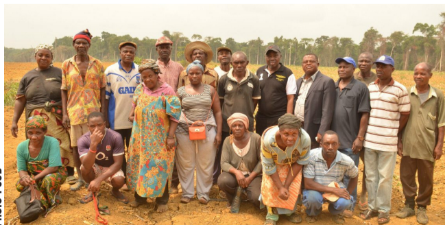
... et ici en compagnie des membres de la coopérative "Terre Promise" de Nzing Meyong.