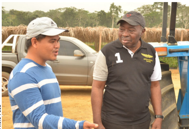
Le sénateur Bernie Bie Emane suivant les explications d'un expert...