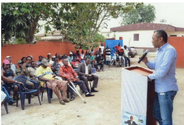
Le député Patrick Eyogo Edzang lors de la causerie avec les jeunes du quartier Est.

Après cette rencontre, l'honorable Eyogo Patrick s'est rendu dans les quartiers de la ville de Bitam, pour remettre des vivres frais et des boissons aux populations. Dans une ambiance festive.