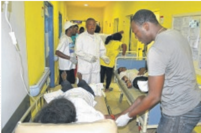
L'accueil des patients aux urgences.