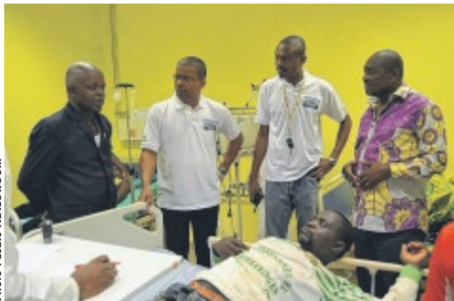
La visite des autorités locales aux accidentés.