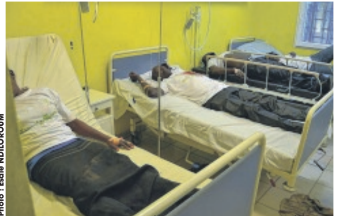
Quelques accidentés en train d'être stabilisés dans une chambre.