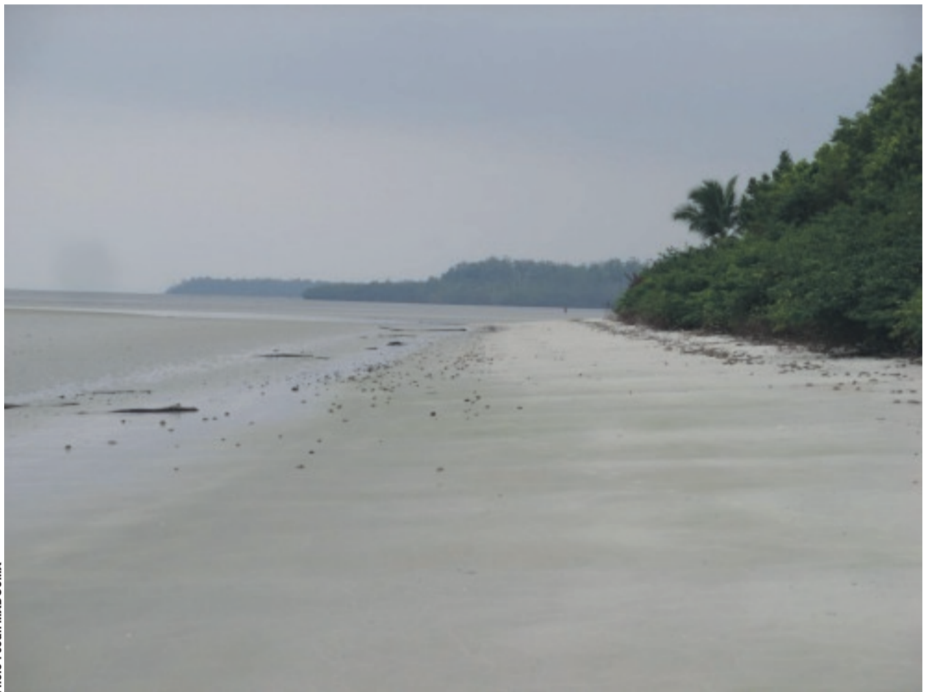
Vue d'un des espaces mis en valeur par notre jeune compatriote.

Autrefois moins fréquenté, le site enregistre aujourd'hui un nombre élevé de visiteurs. Certains, pour le repos, d'autres pour des