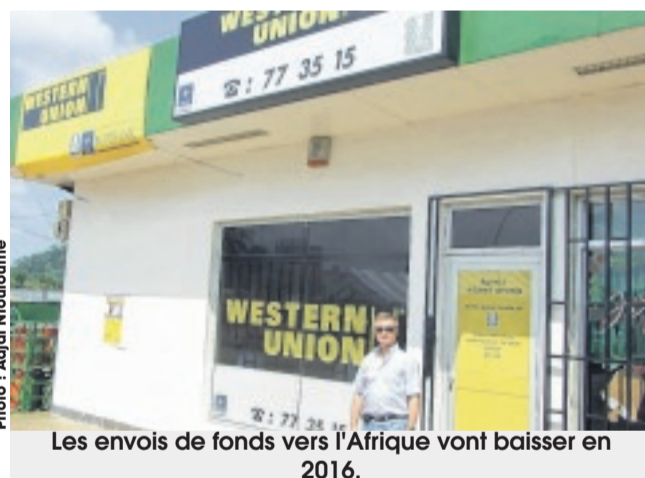
Les envois de fonds vers l'Afrique vont baisser en 2016.

Les estimations tablent sur une augmentation de 0,8 % des transferts d'argent vers les pays à faible revenu et intermédiaire, pour un volume total de 442 milliards de dollars. La modeste hausse enregistrée, cette année, est principalement due à l'augmentation des fonds envoyés en Amérique latine et aux Caraïbes. On prévoit une diminution de 0,5 % des transferts de fonds vers l'Afrique subsaharienne en 2016 tandis que ces flux devraient affi-