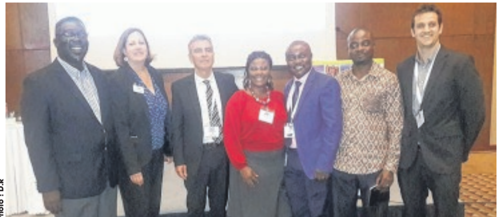
Les membres de la "Society of petroleum engineers" (SPE) international au sortir de la conférence.

tuts locaux et internationaux, grâce au financement de Shell Gabon. Il a également rappelé que Shell Gabon a développé, en 2015, un plan détaillé d'actions sur la biodiversité identifiant les zones prioritaires au sein de ses champs d'opérations sur terre. Ce plan évalue leurs impacts potentiels et indique un certain nombre d'actions pouvant atténuer lesdits impacts. « La conférence SPE d'Accra m'a permis, dans une large mesure, d'être exposé à de nouvelles techniques et outils en matière de gestion environnementale dans les opérations pétrolières. C'est le cas, par exemple, d'une